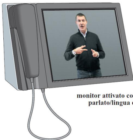
monitor attivato con traduttore parlato/lingua dei segni

Sysnet Telematica, azienda italiana leader nelle telecomunicazioni in collaborazione con ENS (Ente Nazionale Sordi), che eroga il servizio ComunicaENS, ha sviluppato uno